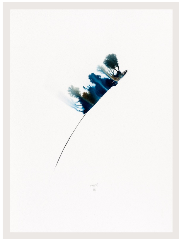
Iz cikla Metulji iz Fukušime, akvarel na papirju, 76 x 56 cm. Na naslovnici: Iz cikla Metulji iz Fukušime, olje na platnu, 80 x 70 cm.