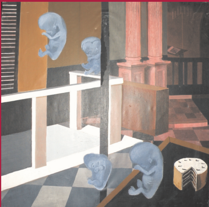
Otroci, 2005, kemični svinčnik in akril na platnu, 160 x 180 cm