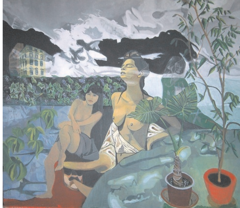
Mimoza, 2005, kemični svinčnik in akril na platnu, 160 x 180 cm

N: Herbersteinova 14, 1000 Ljubljana T: +386 (0)40 756 457 E: zven08@gmail.com http://www.tajaiivancic.webs.com