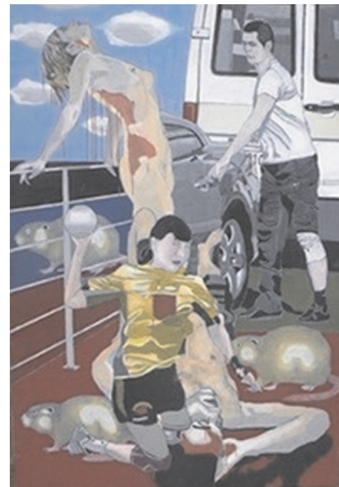
Dera 3 (iz cikla Deratizacija), 2009, olje na platnu, 100 x 70 cm