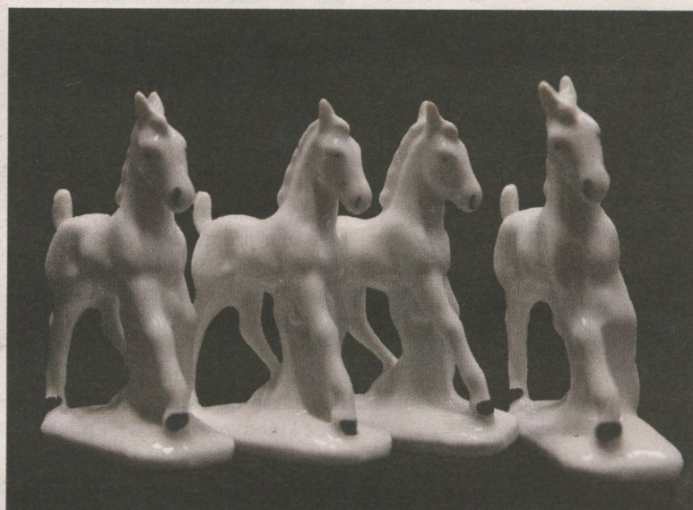
Štirje beli konjički iz zapuščine Cirila Kosmača

Pri tem početju sta bila opažena, Kosmač je bil pridržan v Tolminu, nato pa izpuščen. Novembra 1929 sta bila oba aretirana. Kosmač je bil zaprt v Gorici, Kopru in Rimu. Komaj 19-leten je po ječah, tudi samicah, preživel skoraj leto dni. Na znanem tržaškem procesu je bil najmlajši obtoženec in kot mladoleten oproščen, vendar mu je sodišče naložilo dve leti strogega policijskega nadzorstva: vsak dan se je moral javljati na policijski postaji, ni se smel zaposliti, ni smel obiskovati