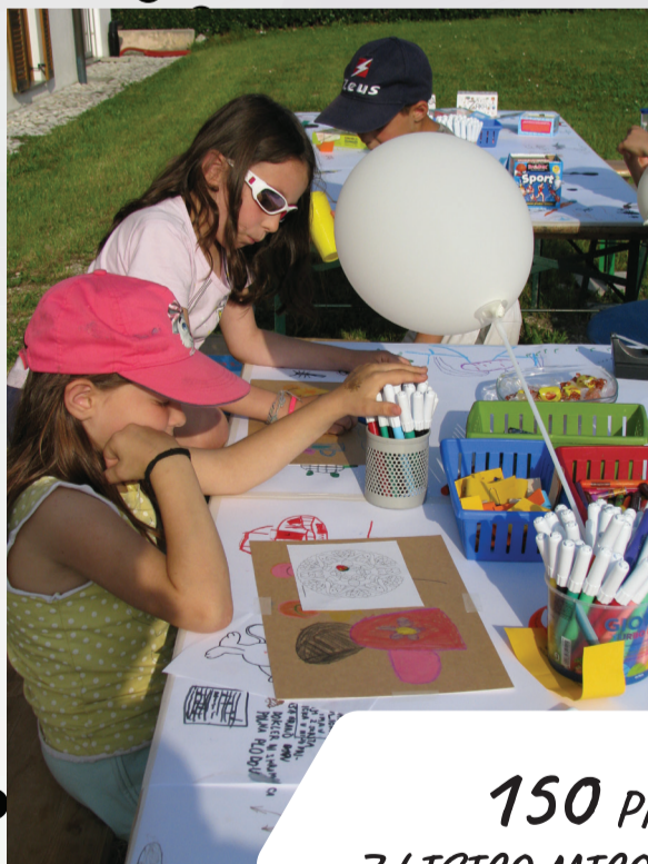
150 PRAVLJICAM Z LISICO MICO JE PRISLUHNILO VEČ KOT 2.200 OTROK